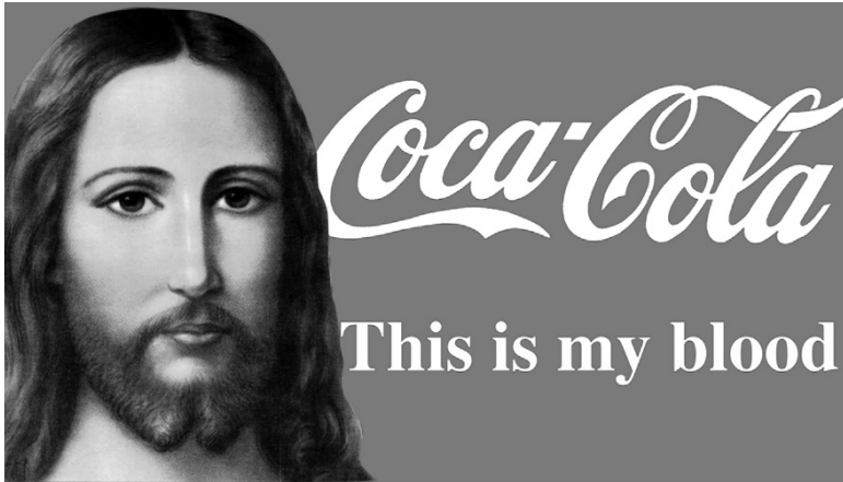
Alexander Kosolapov: „This is my blood“

davon „abgehoben“. Hier liegt ihre besondere Kraft jenseits des leeren Signifikanten auf T-Shirts, Werbeplakaten und Warnschildern. Diese Kraft wird ausgedehnt auf soziale Räume, in denen sie strukturierend und positionierend innerhalb der Gegenwartskultur wirken. Die Konstituierung von Differenzen ist beispielsweise ein Treibstoff der Mode oder der Milieus. So kann ein Kreuz am Revers auf eine besondere soziale Disziplinierung hinweisen und beschreibt gleichzeitig doch auch die eigene Position als öffentlich und religiös. Manche tragen den Lutherkragen als Selbststilisierung, materialgewordene Identitätsstabilisierung oder als Markierung einer sozialen Grenze.