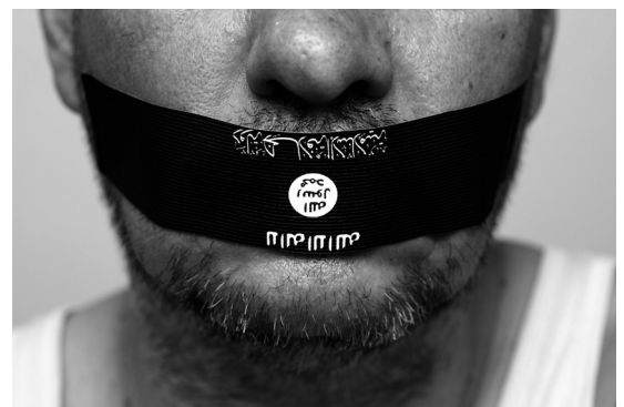
Orientalische Schrift auf schwarzem Grund als Symbol für den ‚Islamischen Staat‘

Wenn man nun an den Gebrauch des Kreuzes auf Plakaten und Transparenten der PEGIDA denkt, wird deutlich, dass hier etwas neu konzeptualisiert und in die eigene Vorstellungswelt inkorporiert werden soll. Die Hoffnung? Vielleicht die Hoffnung darauf, man möge in der PEGIDA die Hüterin einer christlichen Ordnung erkennen, vielleicht ist es aber auch nichts anderes als nur eine idealisierte Selbstbeschreibung. Für mich ist der Gebrauch des Kreuzes hier inakzeptabel, denn es steht genau für das Gegenteil von dem, was ich bei PEGIDA höre. Sollten wir also gerade darum unser Kreuz nicht viel offensiver tragen und deutlich zeigen? Symbole sind Ausdruck einer Position auf dem Feld, auf dem es immer auch um Macht geht. Das will und werde ich den anderen nicht überlassen.